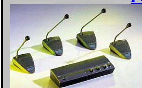
système de discussion BOSCH CCS500 ULTRO